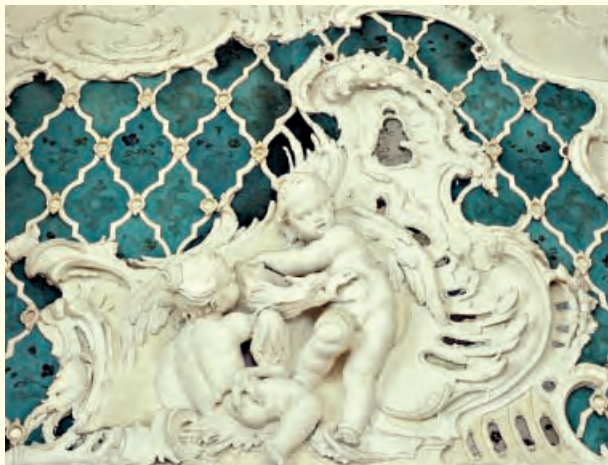
Detail der Stuckaturen im Grünen Kabinett

Die besten Kunsthandwerker der Bodenseeregion statteten die herrschaftlichen Räume im ersten Obergeschoss (Belétage) aus, u.a. Joseph Anton Feuchtmayer, der gemeinsam mit Johann Georg Dirr die feinsten Stuckaturen schuf. Die Arbeiten im zweiten Obergeschoss jedoch kamen aus Geldmangel nicht zur Ausführung.